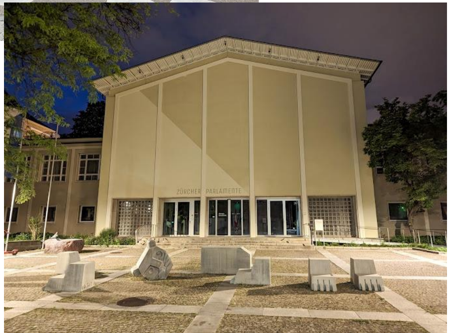
Rathaus Hard, Bullingerstrasse 8, 8004 Zürich